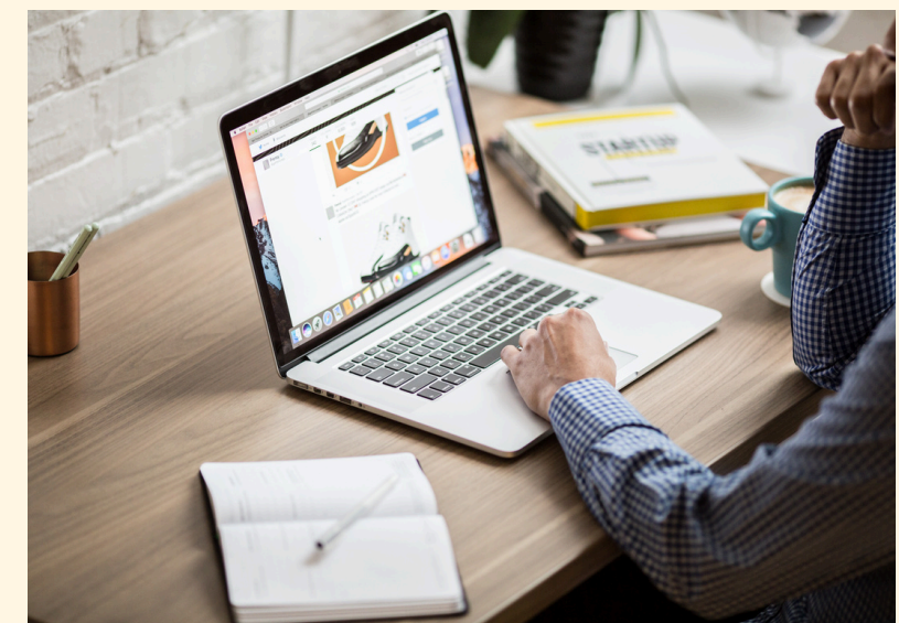
Marketing y diseño digital