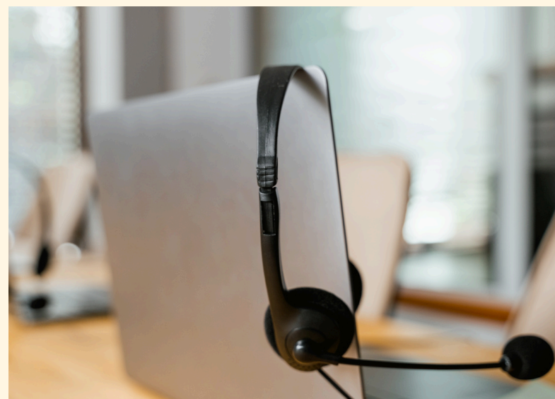
Atención al cliente